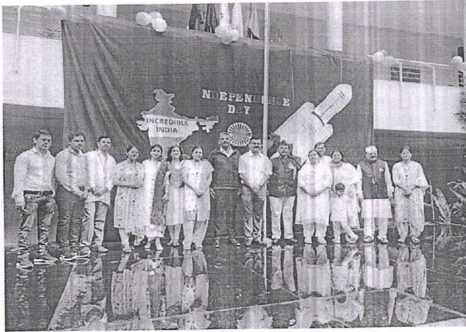
Republic Day celebration 2023-24

Republic Day marks the adoption of India's constitution and the country's transition to a republic on January 26, 1950. On the occasion of Republic Day, a great program was organised. The program started with the unfurling of the flag and National Anthem.