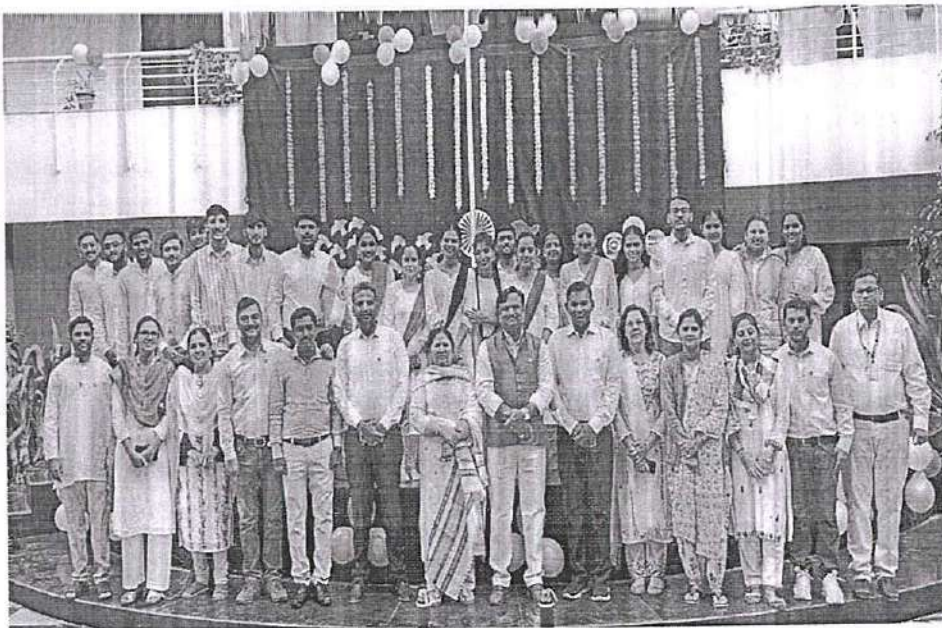
ABS Staff and students on Republic Day 2024

Republic Day marks the adoption of India's constitution and the country's transition to a republic on January 26, 1950. On the occasion of Republic Day, a great program was organised. The program started with the unfurling of the flag and National Anthem.